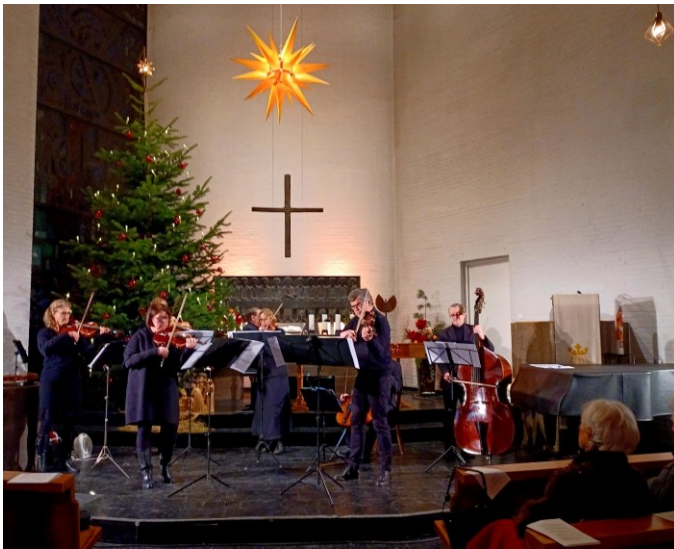
Der musikalische jahresauftakt

hoffentlich sind Sie gut ins neue Jahr 2025 gestartet, wir wünschen allen und unserem Förderverein ebenso, dass es ein erfolgreiches Jahr wird. Wenn es nach dem gelungenen „Jahresauftakt“ geht, dann gibt es keinen Zweifel daran. Unser nächstes Highlight ist schon bald das Neujahrsfest.